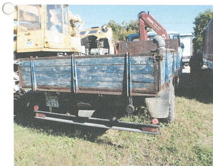
plató és oldalfal vasalatok korrodáltak....