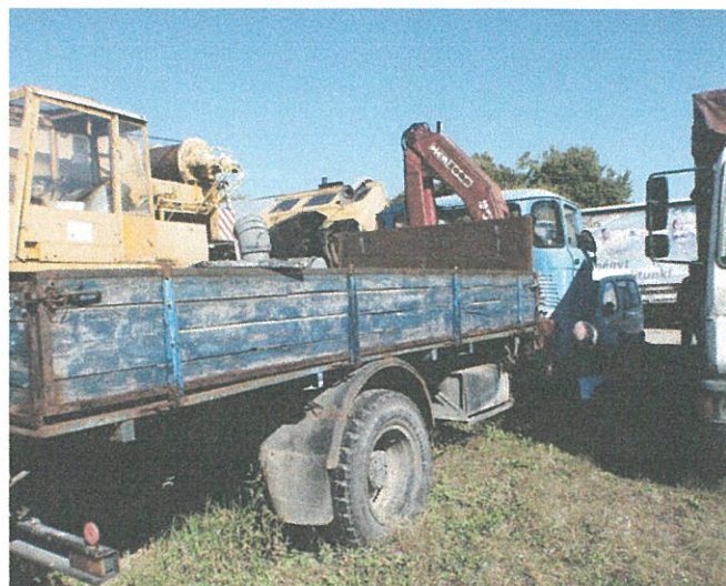
hosszú platós, acél lemezzel borított