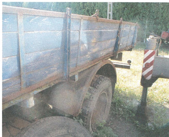
rozsdás plató oldal keret