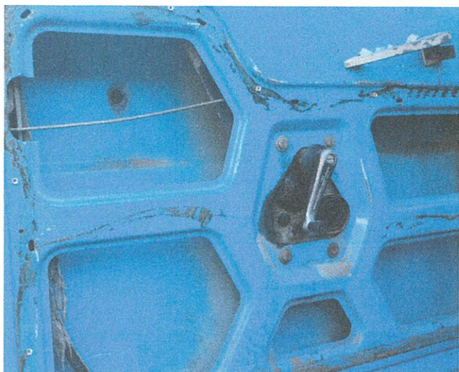
bal e. ajtókárpit hiány