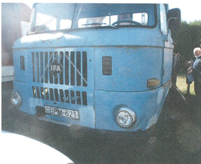
festés matt, karcos