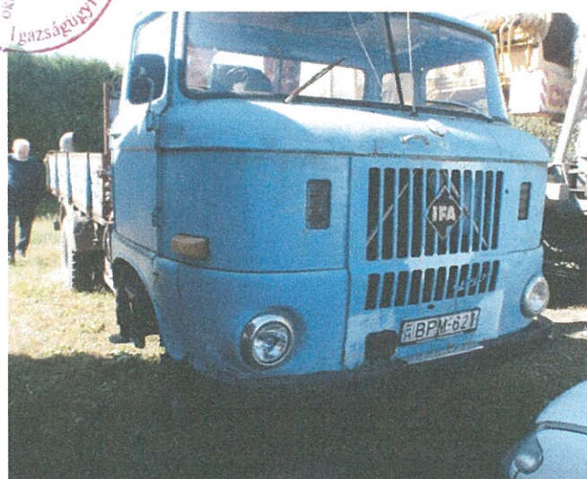
első lökhárító hegesztett, javított