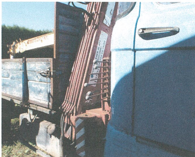
KCR önrakodó javítandó