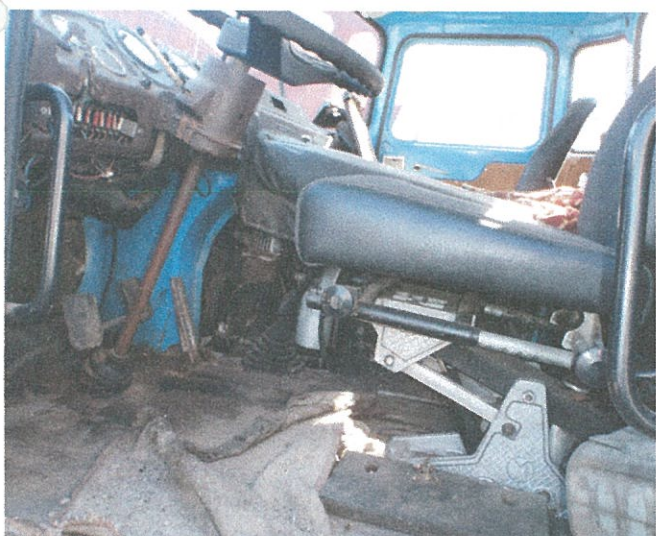
motor borítás hiány, lelakott.....