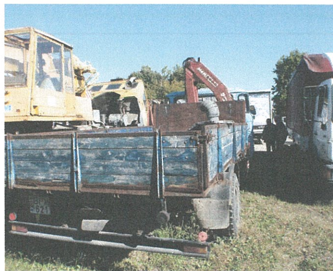
...deszkázat előregedett, repedett