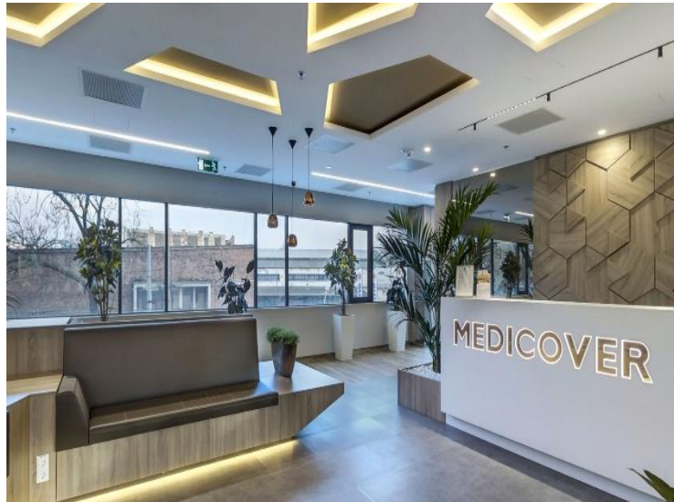
MEDICOVER VISION TOWERS KLINIKA