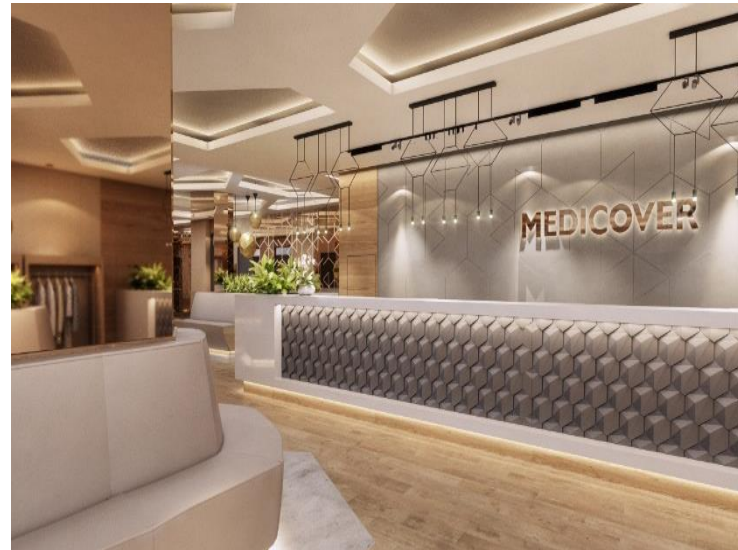
MEDICOVER ALKOTÁS KLINIKA