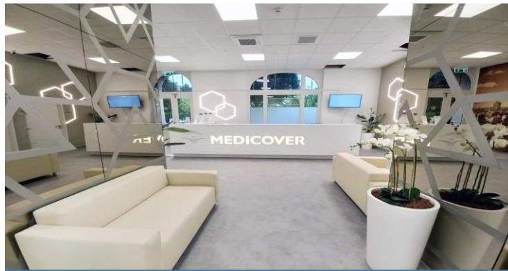
VESZPRÉMI KLINIKA ÉS FOGÁSZAT