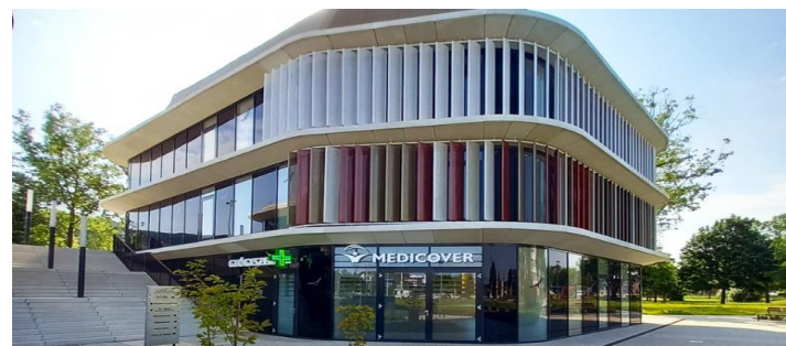
ÚJ! TATABÁNYA KLINIKA ÉS FOGÁSZAT