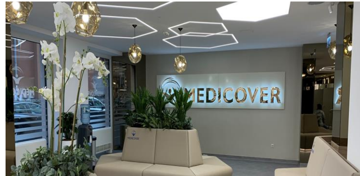
PÉCSI KLINIKA ÉS FOGÁSZAT