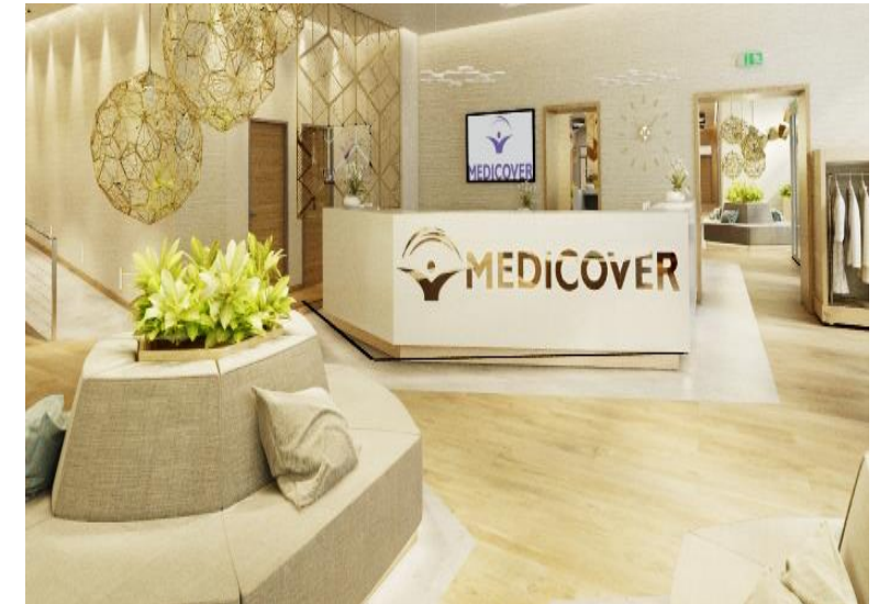
MEDICOVER EIFFEL KLINIKA