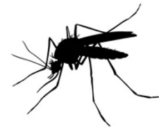
A szívféreg életciklusa

a fertőzőképes L3 stádiumú lárv csak a biológiai vektoraként ismert igazi- vagy csípőszúnyogok (Diptera: Culicidae) családjába tartozó nemek (pl. Aedes , Anopheles és Culex ) több tucat fájának a vérszívó nőtényeiben képes kifejlődni. Az eddigi külföldi vizsgálatok szerint azonban csak néhány fajnak van járványtani szerepe, mivel a szúnyogfajok vektorkompetenciáját számos tényező, így pl. a gazdapreferenciájuk, a szájszervük mérete és a populációk nagysága befolyásolja (Cancrini és Gabrielli, 2007). A hazánkban előforduló mintegy 50 faj közül három ( Anopheles maculipennis , Aedes vexans és Culex pipiens ) esetében bizonyított, hogy ezekben a mikrofiláriák fertőzőképes lárvákká képesek fejlődni, és további három fajról feltételezünk hasonlót (Jacsó, 2014). A nőtény szúnyog a vérszívás során a fertőzött kutya vérében megjelenő mikroszkópius méretű lárvákkal (L1) fertőződik, amelyek egy napon belül a vektor Malpighi-csőveibe kerülnek, és ott először L2, majd L3 lárvákká fejlődnek, miközben kétszer vedlenek. Az utóbbiak a szúnyog szájszerveihez vándorolva, vérszívás közben jutnak a végleges gazdába. A fertőzőképes lárvák szúnyogokban történő fejlődésének az időtartama a környezet hőmérsékletétől függ. Kedvező hőmérséklet (30 °C) esetén ez kb. 8 nap, míg 18 °C-on mintegy egy hónap. Amennyiben a hőmérséklet 14 °C alá csök-