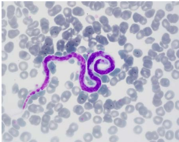
Mikrofilária (első stádiumú lárv) kutya vérkenetében